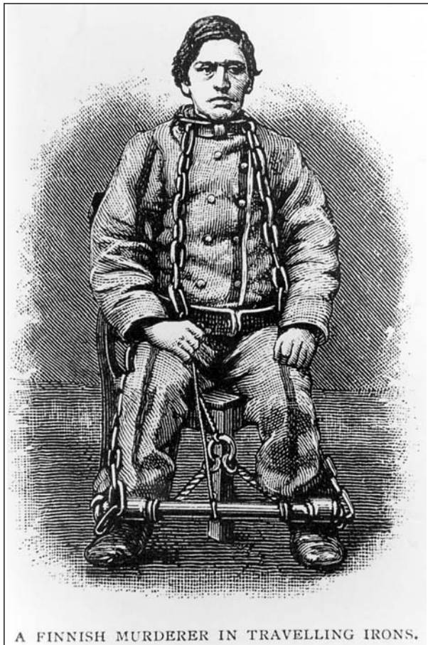
A FINNISH MURDERER IN TRAVELLING IRONS.

Lähde: Juntunen, Suomalaisten karkottaminen , s. 49–55.