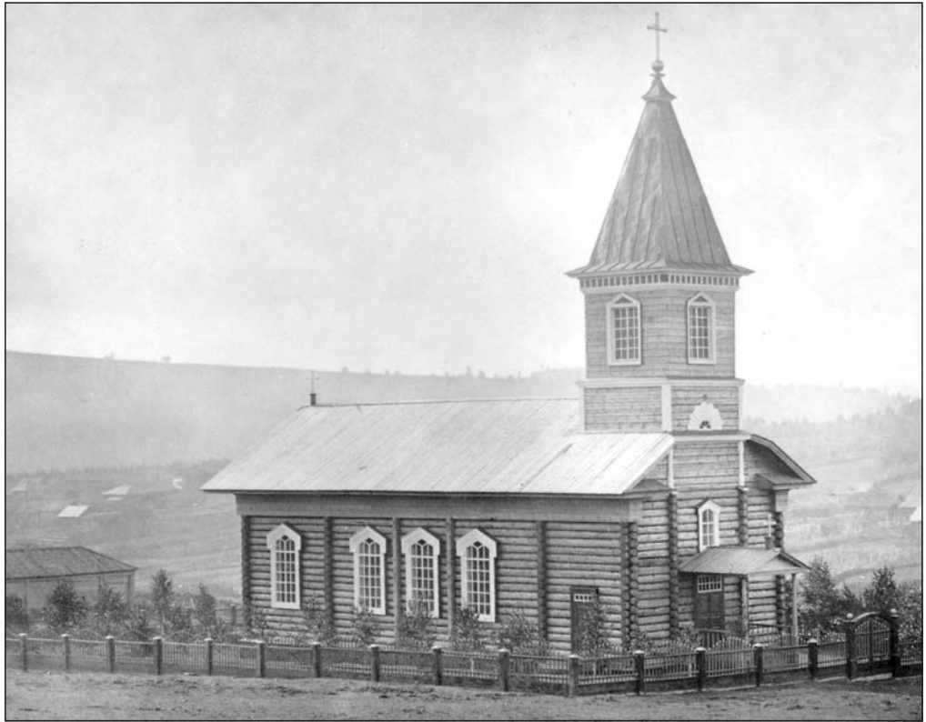
Verhne Suetukin kirkko Minusinskin piirikunnassa.