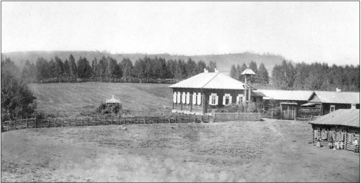
Verhne Suetukin koulurakennus.

kuntaa. Senaatti päätti, ettei muutoksia tehtäisi, mutta ristiriidat ajankohtaistuivat uudelleen maailmansodan aikana. 47