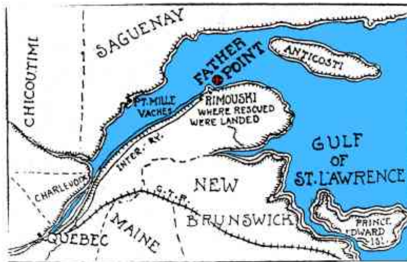
Empress of Irelandin uppoamispaikka.

St. Lawrence -joella, muutama kilometri itään Pointe-au-Perestä, on vieläkin punainen poiju paikassa, johon alus vajosi. Jo kesällä 1914 pääsivät sukeltajat nostamaan laivan arvokasta lastia. Hylky unohdettiin sitten vuosikymmeniksi ja "löydettiin" uudestaan muutama vuosi sitten. Sukeltajat ovat halunneet räjäyttää hyllyn päästäkseen käsiksi mahdollisesti aluksessa edelleen olevaan arvotavaraan. Empress of Ireland makaa pohjassa siten, että sen syvyys pinnasta on noin 25-50 metriä.