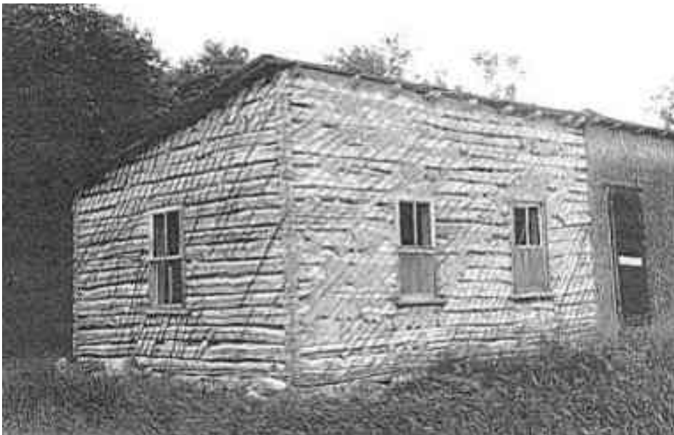
Autoitunut Fred Nordlundin pulpettikattoinen savella päällystetty talo.

Uuden Suomen uudisasutus perustui vuonna 1872 aloitettuun township and range -järjestelmään, jonka mukaan maat jaettiin asutusta varten ensin kooltaan 6 kertaa 6