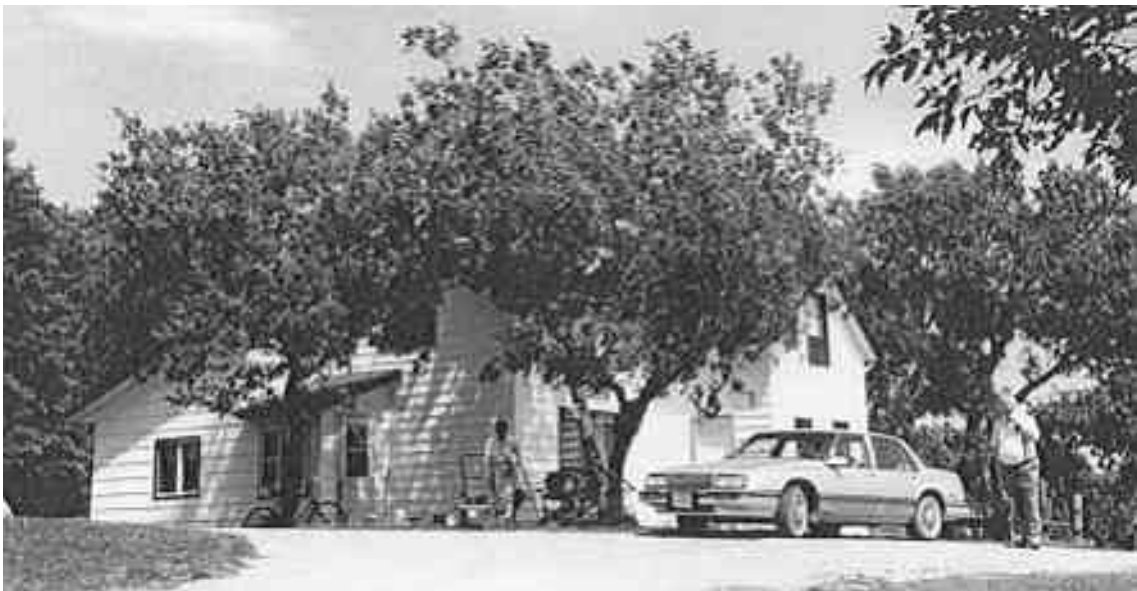
Huhtalan päärakennus Uudessa Suomessa vuosina 1919 ja 1995.

Uuden Suomen territoriaalinen kehitys voidaan nähdä väestömäärän tavoin kolmivaiheisena prosessina: 1) Alueen kasvu 1888- n. 1950. Tänä aikana suomalaiset hankkivat omistukseensa uusia maa-aloja ja kasvattivat Uuden Suomen pinta-alaa. 2) Alueellinen vakiintuminen n. 1950- n. 1985. Suomalaista alkuperää olevien asuttama alue säilyi vakiintuneena, vaikka väestömäärä alkoi jo vähentyä. Väestömäärän vähentymisen seura-